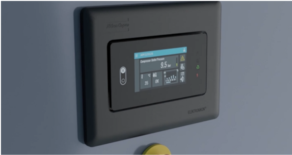
Img in slider plus intro